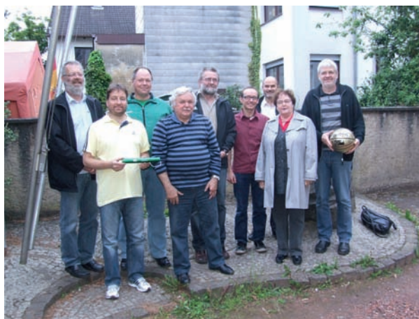
Das DJK-Diözesansportfest-Vorbereitungsteam bei der Staffeltstabübergabe im Mai 2012.

Mit Anmeldung zum Diözesansportfest wird gleichzeitig eine Einverständniserklärung hierzu gegeben. Wer nicht einverstanden ist, ist aufgefordert, dies schriftlich vor Beginn des Diözesansportfestes dem Veranstalter DJK-Sportverband Diözesanverband Trier mitzuteilen.